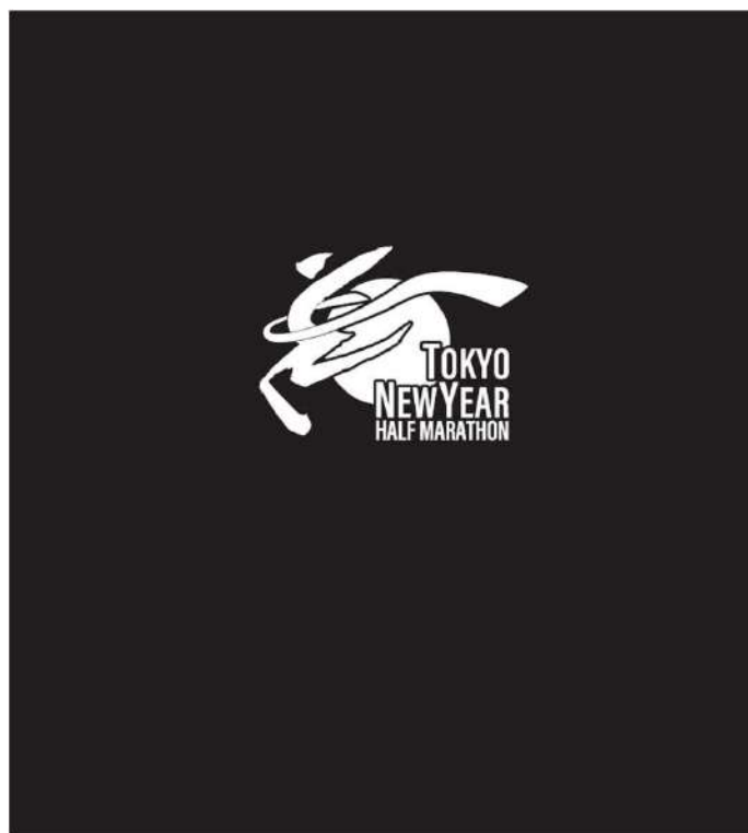
ネックウォーマー